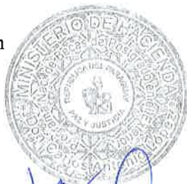
[Signature] Lea Giménez Ministra Ministerio de Hacienda